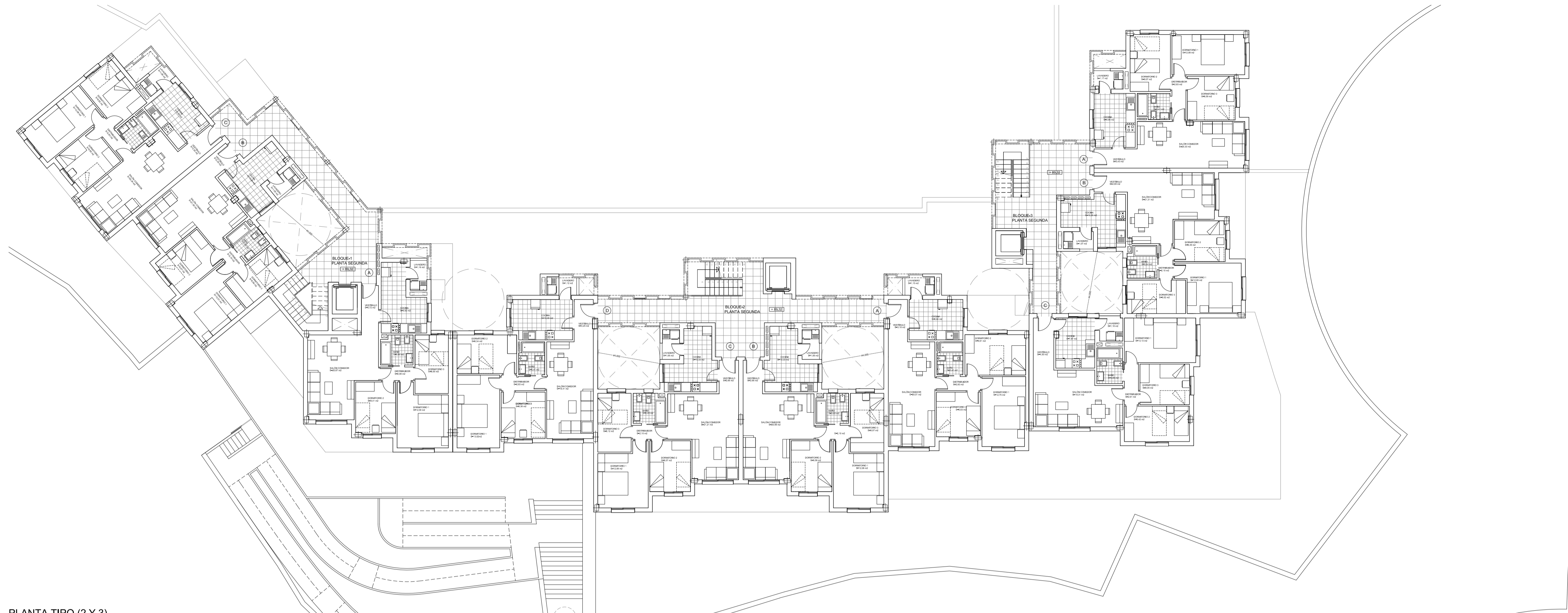
PLANTA TIPO (2 Y 3)